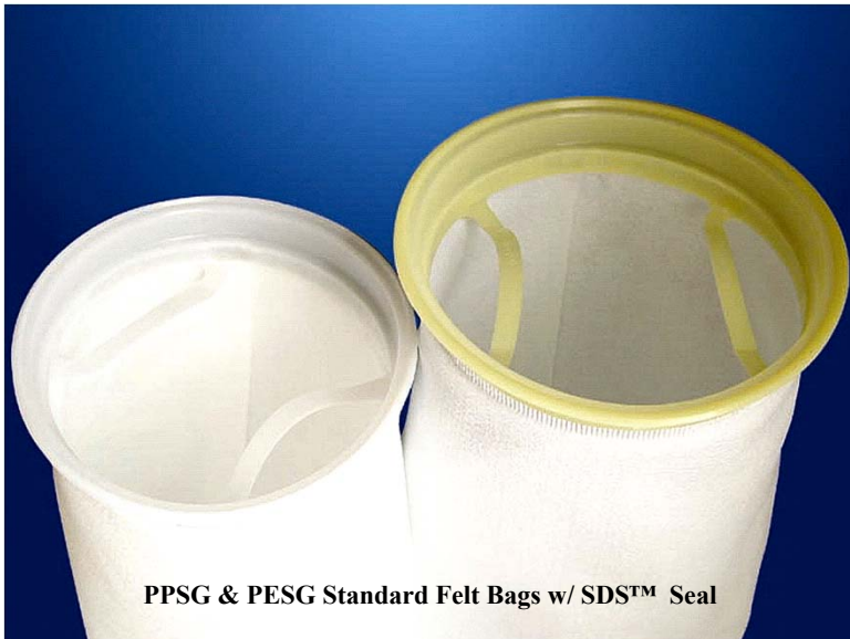
PPSG & PESG Standard Felt Bags w/ SDS™ Seal