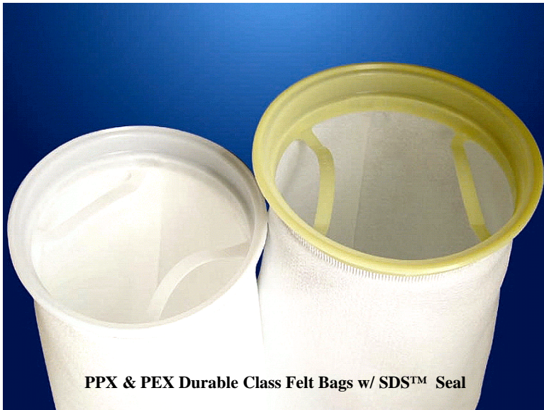
PPX & PEX Durable Class Felt Bags w/ SDS™ Seal

2次側への繊維離脱をふせぐため、ろ材2次側に表面処理を施しているスタンダードモデルに対し、離脱防止とろ材保護のため2次側にスパンボンド不織布を使用。